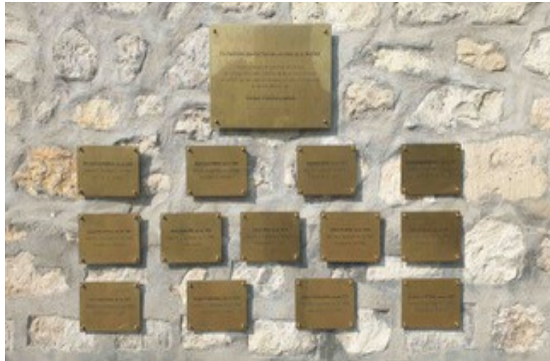
Plaques commémoratives des Juifs de Cachan victimes de la Shoah

Une nouvelle édition, publiée par les Editions L'Harmattan, approfondit certains pans de l'histoire et aspects de la sinistre collaboration de l'Etat français de Vichy avec les autorités allemandes d'occupation et leur idéologie nazie : une nécessité vitale en cette époque de regain d'antisémitisme.