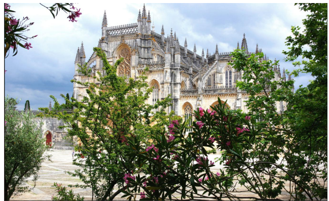
Batalha

La ville fortifiée de Tomar garde de nombreux souvenirs de l'époque où elle était le siège de l'Ordre du Temple. Henri le Navigateur en fut le Grand Maître. Un immense monastère, le Convento do Cristo , se développa autour de l'ancienne église ronde des Templiers.